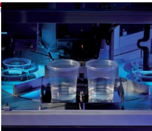
station 4 wypchnięcie zamkniętych kubków i wysunięcie ich na podajnik poza dozownikiem