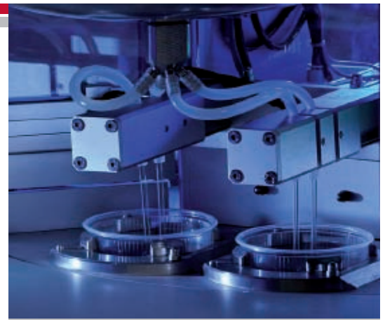
station 2 dozowanie pożywki z teflonowanego zbiornika bezpośrednio do kubków