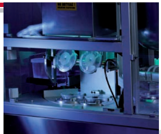
station 3 pobieranie sterylnych pokrywek i zamykanie kubków